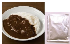
濃厚プレミアムカレー (150g)

期 間：2020年8月28日(金)～8月30日(日) 内 容：当店でお食事ご利用のお客様に、100時間カレーの味がご家庭で楽しめる、100時間カレーレトルト「濃厚プレミアムカレー」を差し上げます。 1日100組様限定、先着順とさせていただきますので、この機会に是非お早目にご利用ください。